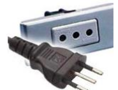
Tipo C: Válido para clavijas E y F Tipo L: Válido para clavijas C

Impuestos: Toda compra en Chile está gravada con un Impuesto de Ventas de 19%.